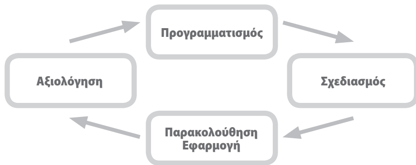
ΣΧΗΜΑ 1: ΚΥΚΛΟΣ ΠΡΟΓΡΑΜΜΑΤΟΣ